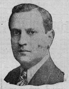
DR. CALDERON GUARDIA

Hoy parte para Worcester, Massachusetts, el doctor Calderón Guardia a donde aceptará el jueves el nombramiento de Doctor Honor Causa, que hace la Universidad de Holy Cross. — Nuevas e importantes informaciones exclusivas ofrece NOVEDADES, así como una relación radiográfica de las atenciones en Chicago. —